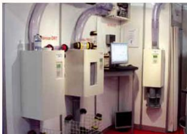
Ukázka stanic systému potrubní pošty

Systém instalovaný ve Fakultní nemocnici Brno byl v době své instalace velmi moderní a svým rozsahem patřil k významnějším instalacím ve zdravotnictví v celé Evropě.